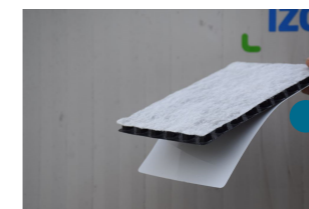
9 - ND 120