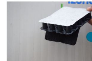
6 - ND 5+1